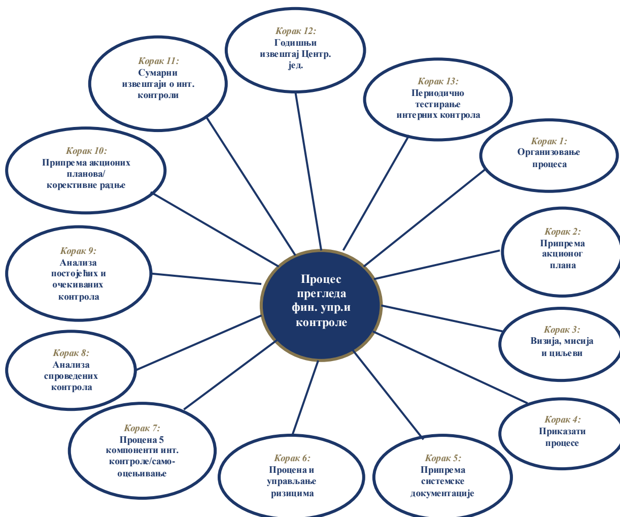
Дијаграм број 1: Шематски приказ, успостављања, спровођења и развоја система за финансијско управљање и контролу 11

Руководство је одговорно за успостављање одговарајуће организационе структуре која јасно додељује одговорности и овлашћења, одређује одговарајуће контроле и надзире њихову адекватност и ефективност. Укључивање највишег руководства у питања интерне контроле је од кључне важности за постизање њене ефективности, чиме се даје тон који одређује да ли контролно окружење доприноси ефикасном функционисању интерне контроле. Осим руководства, у осигуравању постојања и функционисања интерне контроле своју значајну улогу имају и сви запослени.